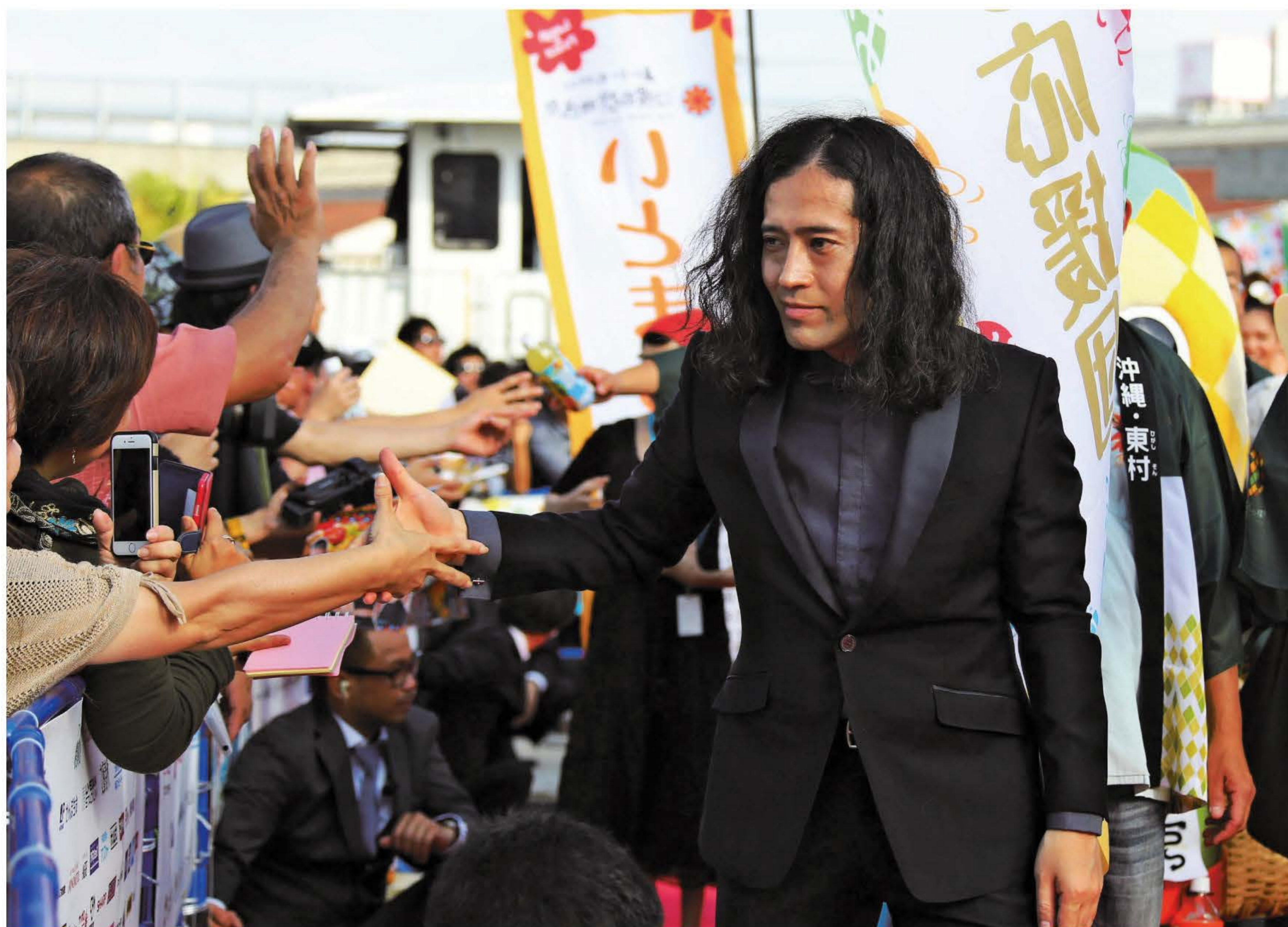
ファンと触れ合いながら、ゆっくりとレッドカーペットの歩行を楽しんだ又吉直樹

「島ぜんぶでおーきな祭 第8回沖縄国際映画祭」(同実行委主催)が21日、波の上みそら公園を主会場に始まった。24日まで。海辺の同公園にはステージまで鮮やかなレッドカーペットが敷きつめられ、その周囲は観衆でぎっしり。映画に出演した斎藤工やすみれ、芸人のガレッジセールらが姿をみせると歓声が沸いた。