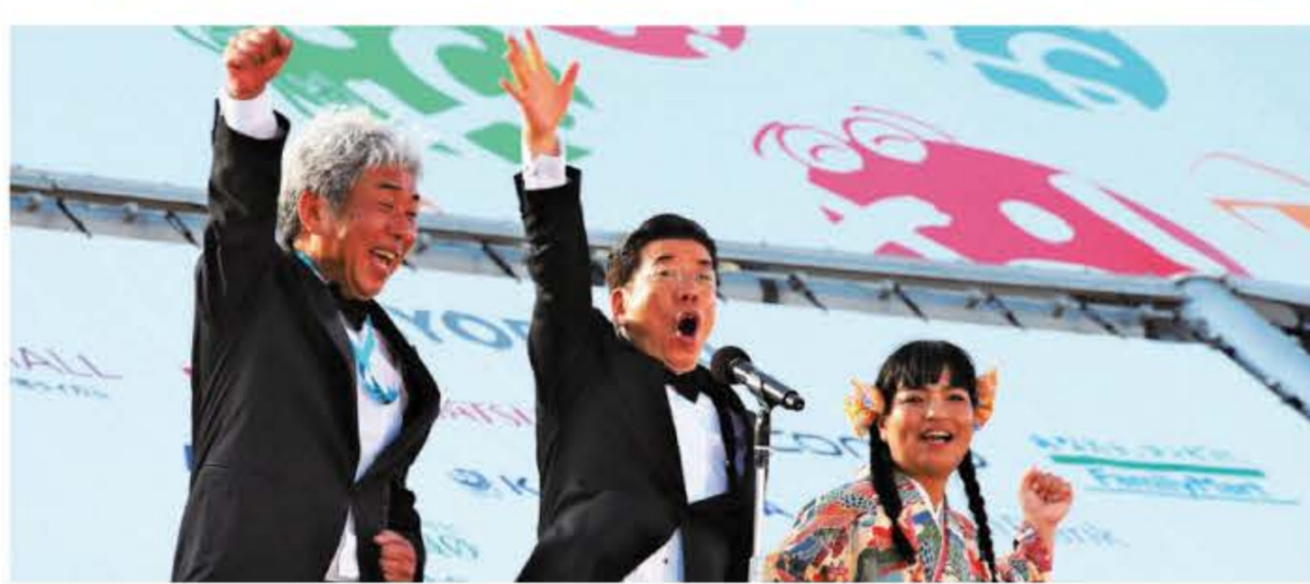
⑤オープニングセレモニーを盛り上げた西川きよし(中央)ら